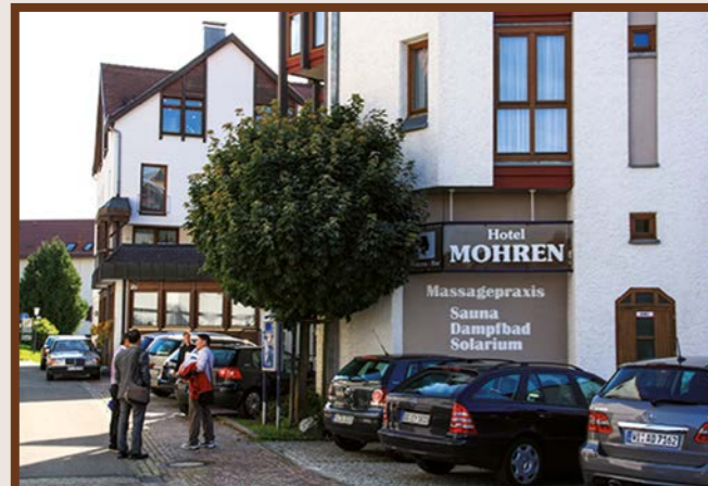
3 Ringhotel Mohren