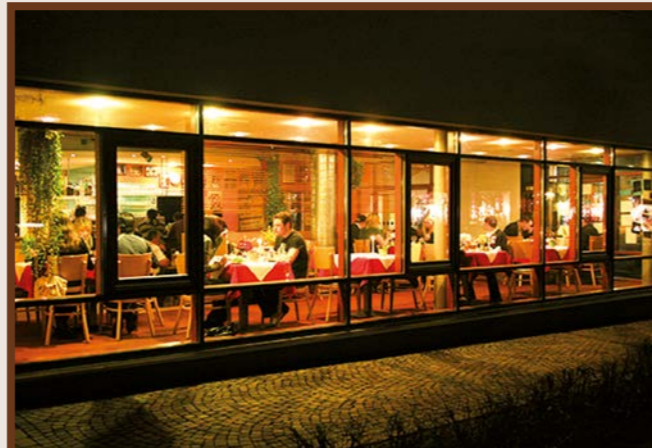
2 Steakhaus OX fifty-four