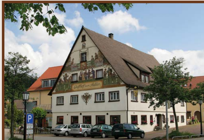
1 Gasthof Adler

Ob Empfänge, Familienfeiern, Einweihungsfeiern, Silvester-, Garten- oder Geburtstagsparty, wir bieten Ihnen die tollsten Büfets, Menüs und Grillstationen.